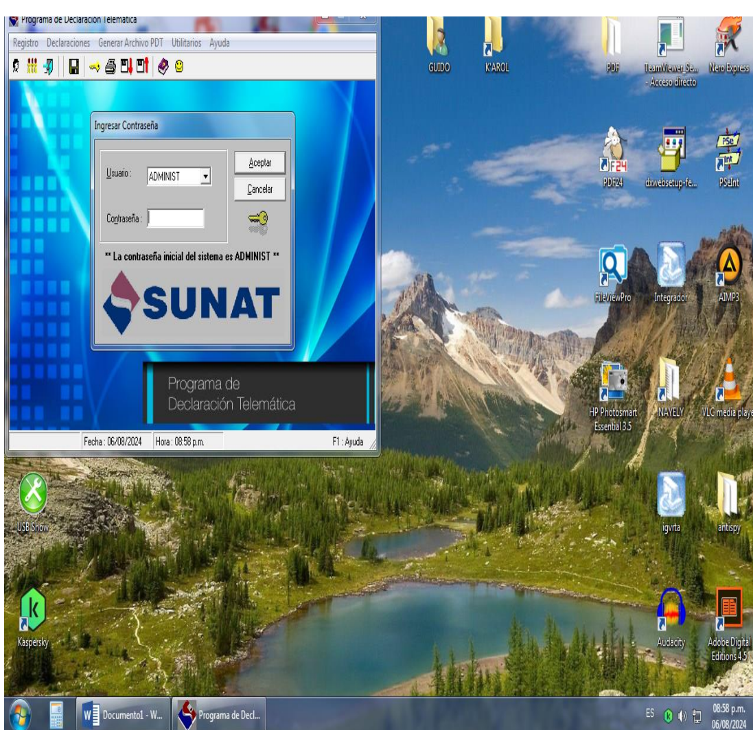
Figura 5 Acceso A PDT SUNAT

Nota: Ingreso al Programa de Declaración Telemática