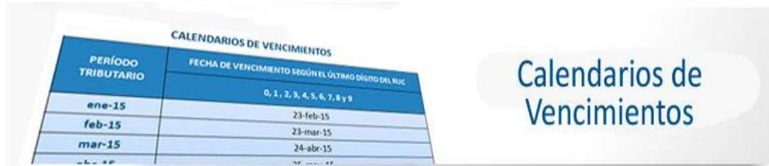
Cronograma de Obligaciones MENSUALES - EJERCICIO 2023