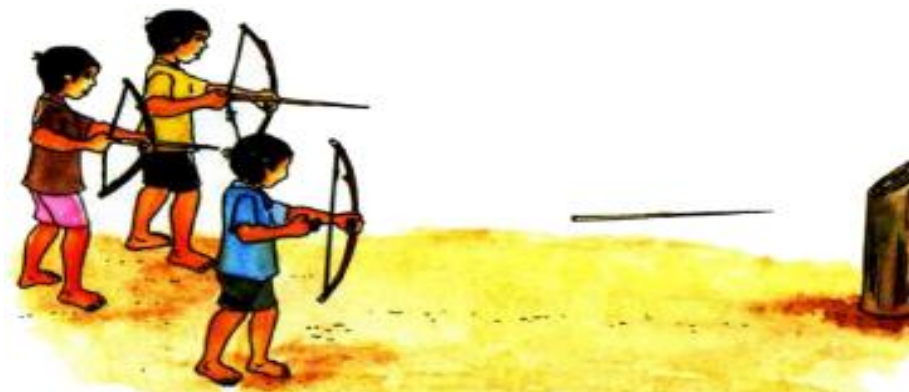
Juego con flechas