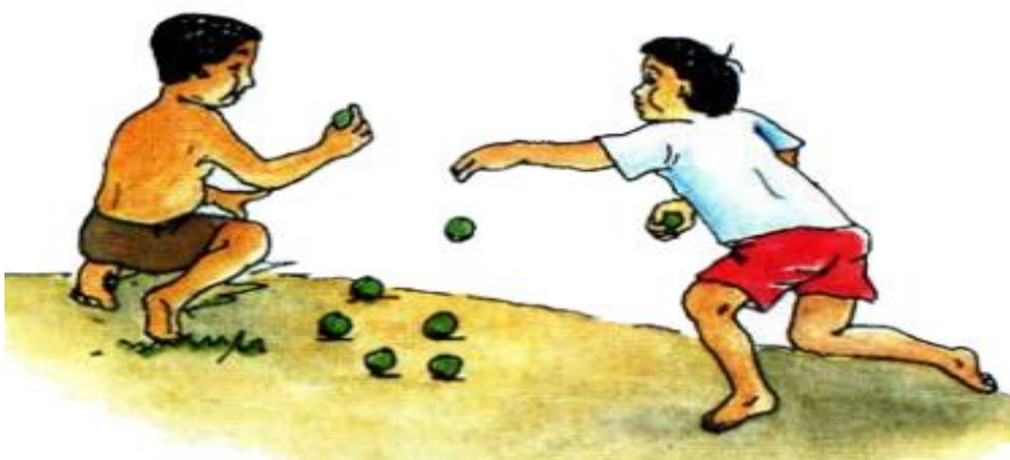
Juego de boliches