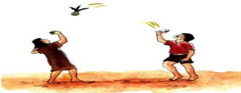
Juego de Chotanka o chotari