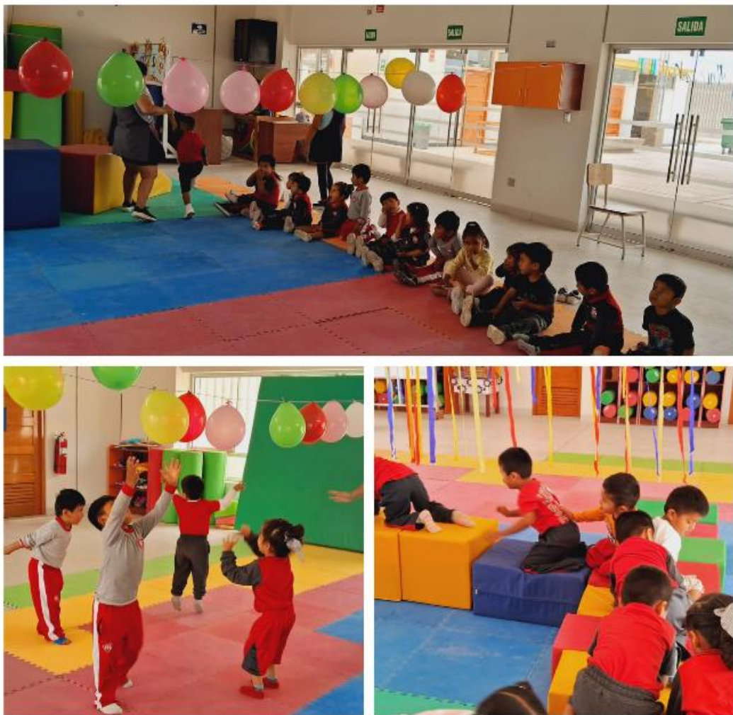
Figura 4 Ejercicios de relajación

En nuestros talleres de psicomotricidad, seguimos un ritual de 45 minutos donde los niños se quitan los zapatos y saludan, lo cual proporciona un marco estructurado y reconfortante para ellos. Se realiza la asamblea, la maestra menciona los acuerdos que son muy esenciales y que se practica en todo tipo de jornada “me cuido” “cuido a mi compañero” y “cuido el material” indicándoles también que se anunciará 10 min antes de terminar dicho taller, al culminar los acuerdos que son muy esenciales y que se practica en todo tipo de jornada “me cuido” “cuido a mi compañero” y “cuido el material”. para finalizar la actividad se realiza ejercicios de relajación los niños y niñas expresan como se sintieron luego lo representan gráficamente lo realizado. Es crucial que el niño perciba un inicio y un cierre en estas actividades.