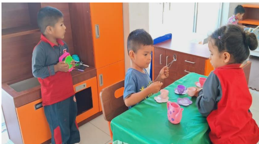
Figura 3 Juego heurístico

En el sector del hogar y en la mayoría de los espacios de juego, procuramos utilizar una amplia gama de materiales reales y objetos en desuso, además de donaciones de los padres como teléfonos a tamaño natural. Evitamos lo demasiado infantil y optamos por materiales más auténticos. En el área de cuentos y literatura, no solo ofrecemos cuentos, sino también revistas de geografía, viajes y cocina. Contamos con un área de construcción equipada con bloques de madera y damos prioridad a materiales naturales, limitando el uso de plásticos. Integramos ampliamente material heurístico, de manera que cuando hablamos de juego, nos referimos no solo a juguetes, sino a todos estos recursos. En el juego heurístico, el niño interactúa con una variedad de materiales como reglas, tronquitos cortados y envases reciclados, entre otros.