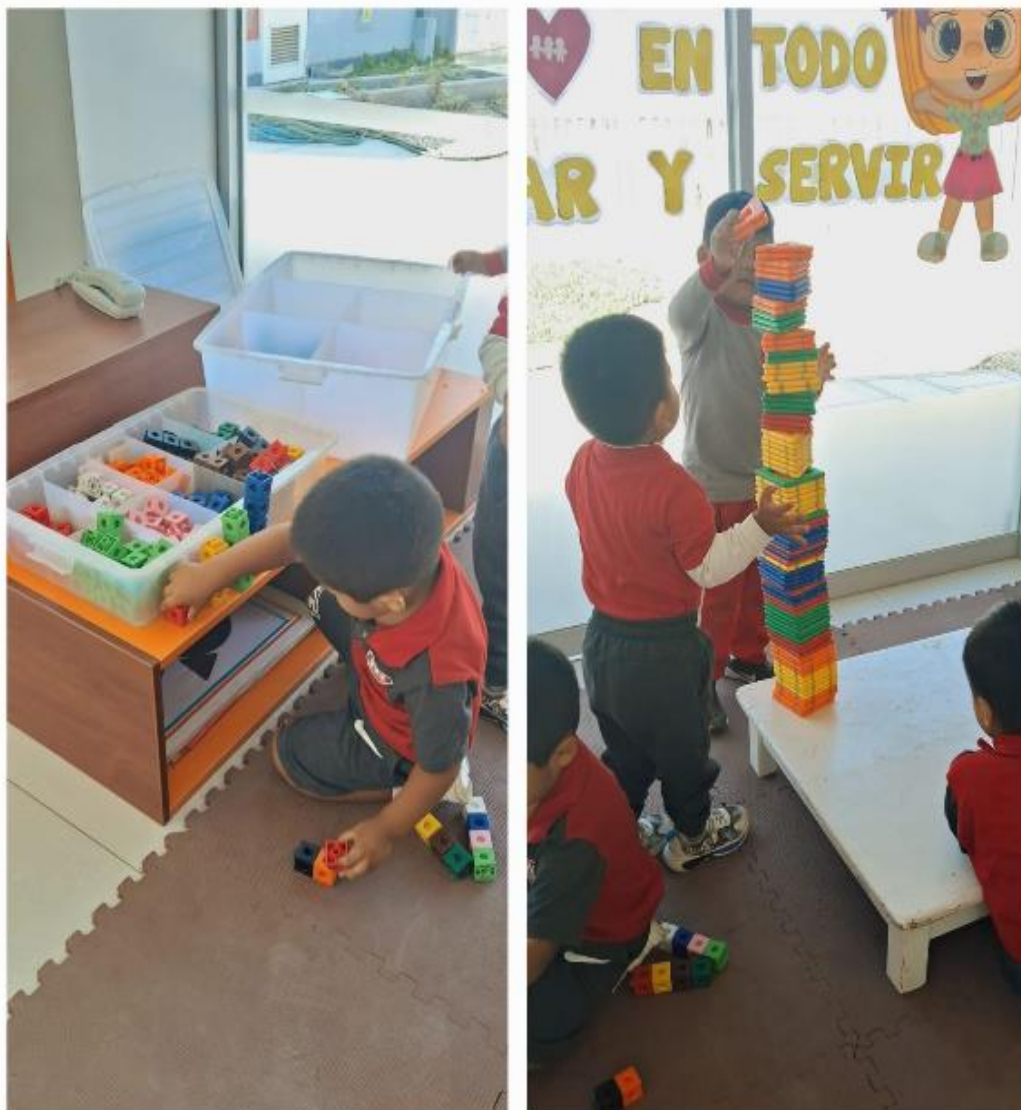
Jugando con los LEGOS

El sector de lectura es fundamental para fomentar las habilidades comunicativas en los niños, además de ser parte integrante del Plan Lector. Se recomienda disponer de un mueble como una repisa, anaquel o librero, donde se puedan exhibir diversos textos. Estos incluyen trabajos creados y elaborados por los niños, la docente, los padres de familia, así como aquellos donados o entregados. Este espacio está destinado a promover el amor por la lectura y facilitar el acceso a una variedad de materiales escritos dentro del entorno educativo.