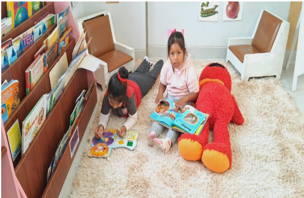
Figura 7 Plan lector

Durante la hora del juego libre en los diferentes sectores, el papel de la maestra es el más significativo que es el de observar. La observación diaria cumple varios propósitos fundamentales: