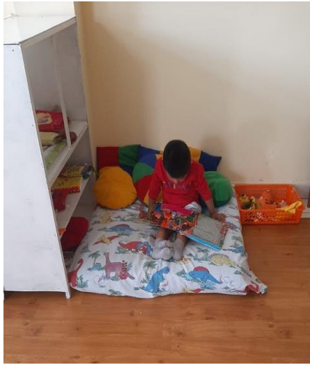
Figura 4 Panel fotográfico de niños interactuando