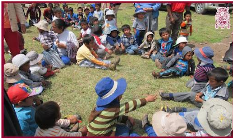
Nota: Minedu (2016) capacitación docente.

de la vida estuvo presente; desarrollando la imaginación, la creatividad, esencial para la formación personal de los seres vivos durante las etapas de su vida.