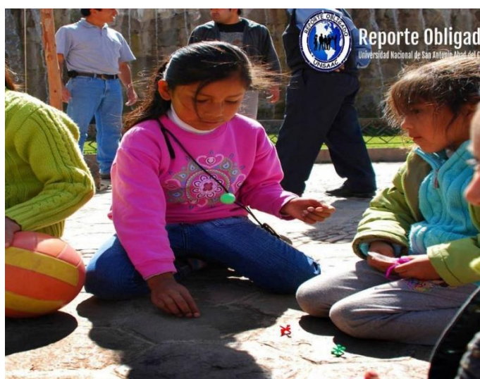
Nota: Minedu (2016) capacitación docente.

De lo dicho por el autor se puede manifestar que a los estudiantes se debe plantear retos en el aula de tal manera que entre ellos deban dar soluciones matemáticas a situaciones reales a través del juego; para ello es importante mantener un clima de respeto entre ellos. Por otro lado, los mismos autores arriba citados llegan a la conclusión con respecto al uso del juego como metodológica hacia la matemática: